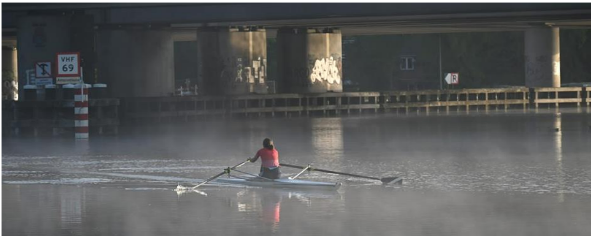
Met een beetje geluk hangt er een zweempje mist over het water tijdens je vaardigheidsproef

Op drie vroege zaterdagochtenden in mei, juli en augustus zijn er vaardigheidsproeven georganiseerd. Negentien leden hebben de vaardigheidsproef afgelegd: vier in de skiff en vijftien in een C1. De jongste deelnemer was 27, de oudste 78. Allen zijn geslaagd. Communicatie over aanmelding voor de vaardigheidsproef ging via de agenda op de website en de aankondiging op het prikbord in gang.