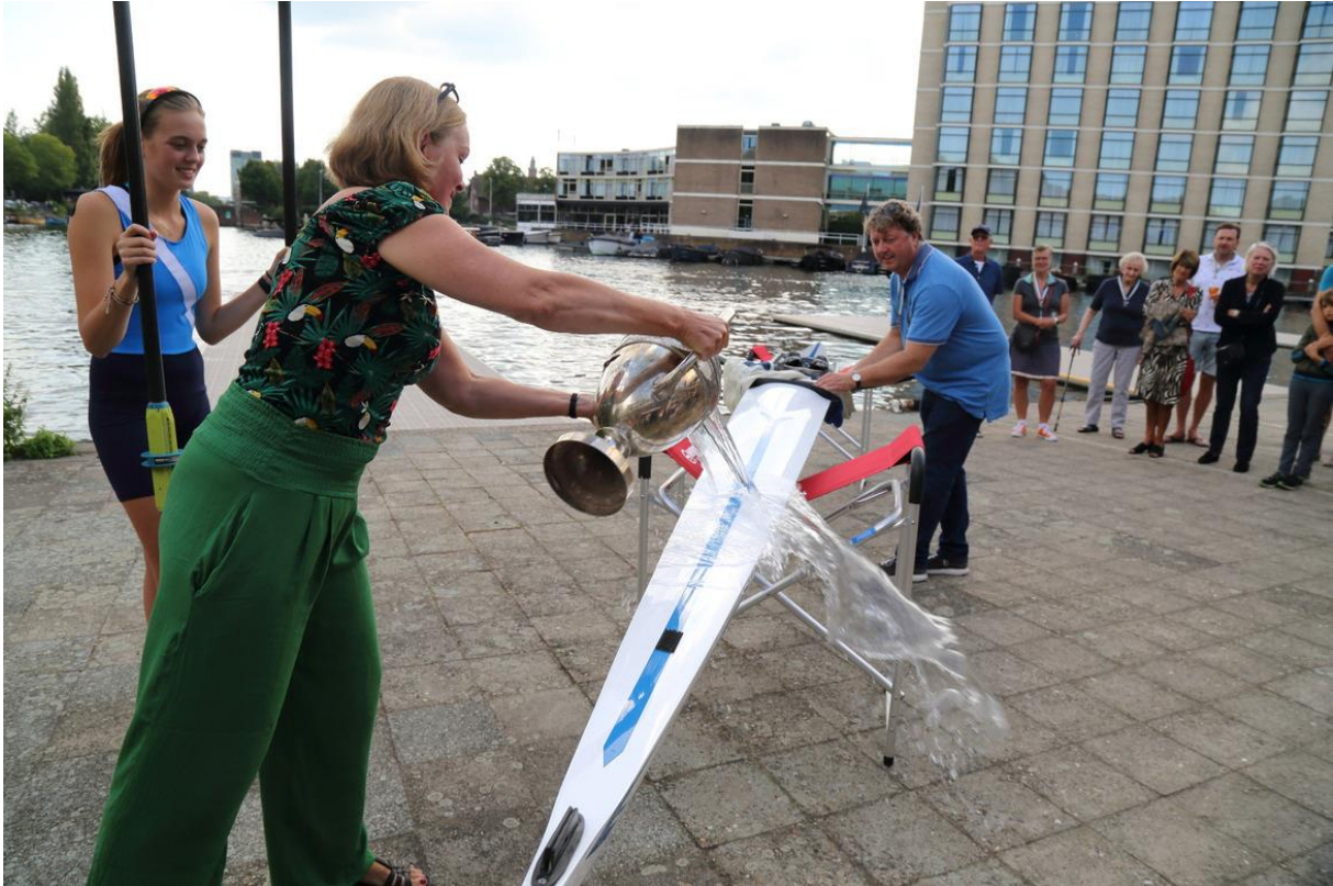
Doopster, voorroeiër en vlootcommissaris gevangen op één foto

Gezien er dit jaar helaas toch wel wat riemen zijn gesneuveld, door aanvaringen hebben we twaalf paar skulls gekocht. Deze worden straks weer volop ingezet, zodat iedereen z'n roeibewegingen kan blijven doen.