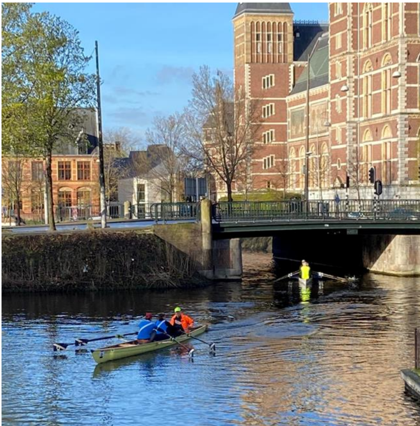
Een Amstelploeg passeert het Rijksmuseum tijdens de Amstelmarathon