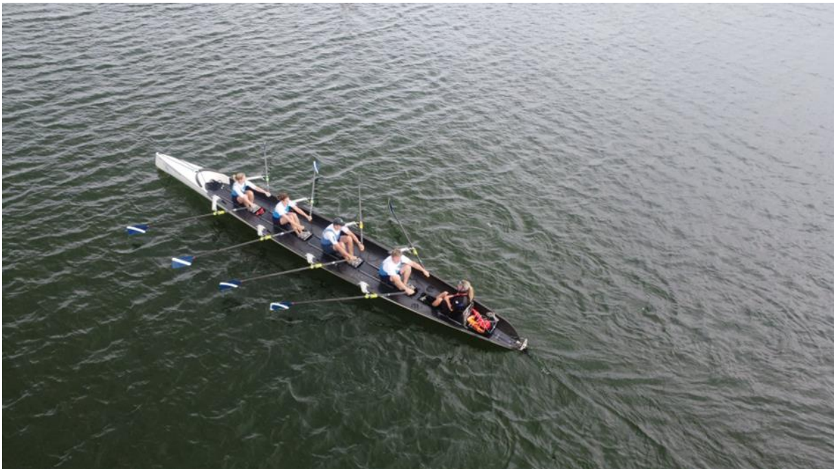
Amstelploeg tijdens de IJmeer Challenge

De IJmeer Challenge werd op 25 september 2022 verroeid, georganiseerd door onze eigen vereniging in samenwerking met Watersportvereniging IJburg en vond plaats op het strand van IJburg. Met windkracht twee lag de uitdaging deze editie vooral in het scherp sturen in de bochten. Olga Duijn stuurde een Laak/Laga ploeg naar de overwinning in het herenveld. Omdat de IJmeer Challenge de laatste coastalwedstrijd van het seizoen is, werden de uitslagen van de klassementen bekend gemaakt. De Amstel won beste mixploeg van het klassement 2022!