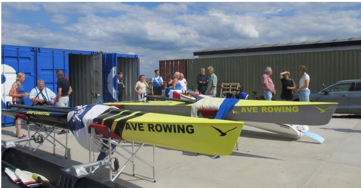
Coastalroeien krijgt serieuze vormen met aanschaf nieuw materiaal en onderkomen