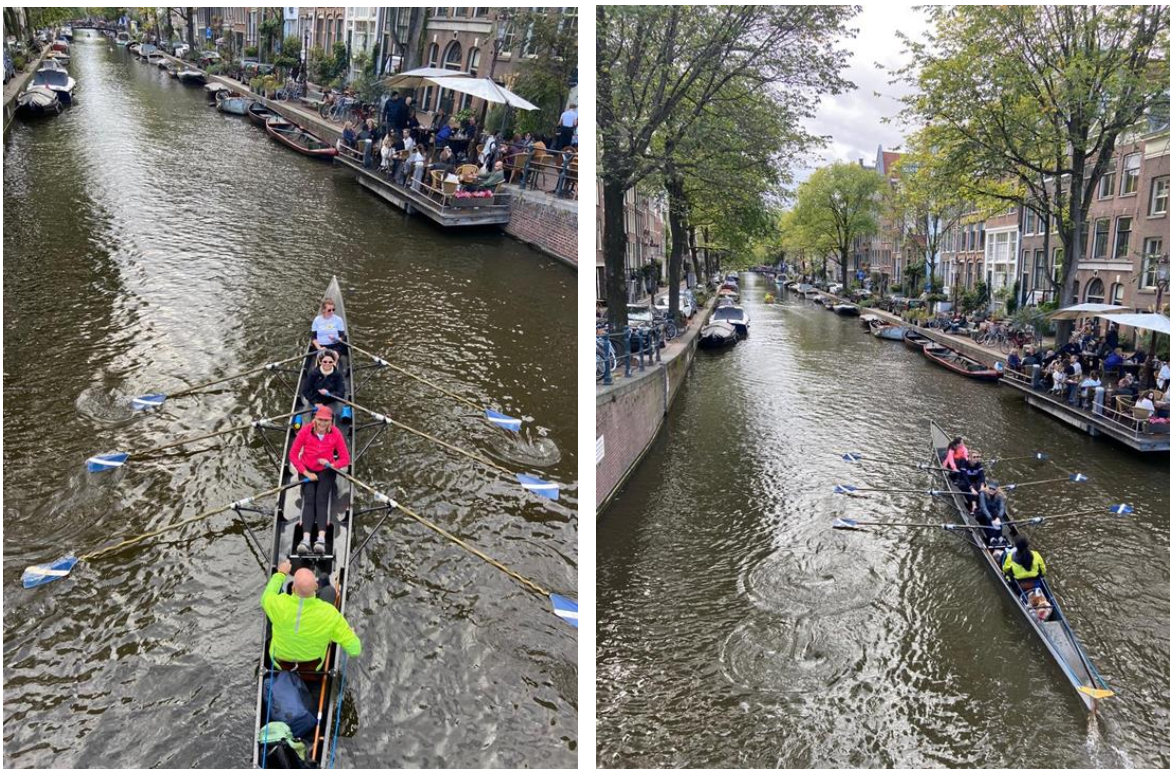
Mysteroeitoer door de smalle grachten

Daarnaast overwegen we een vervolg te organiseren op de succesvolle Mysteroeitoer, maar ook andere ideeën dan het oplossen van kleine mysteries als centraal idee nemen we in overweging.