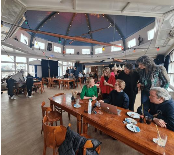
Gezelligheid en concentratie tijdens de Masterclinic bij het evalueren van de video-opnames