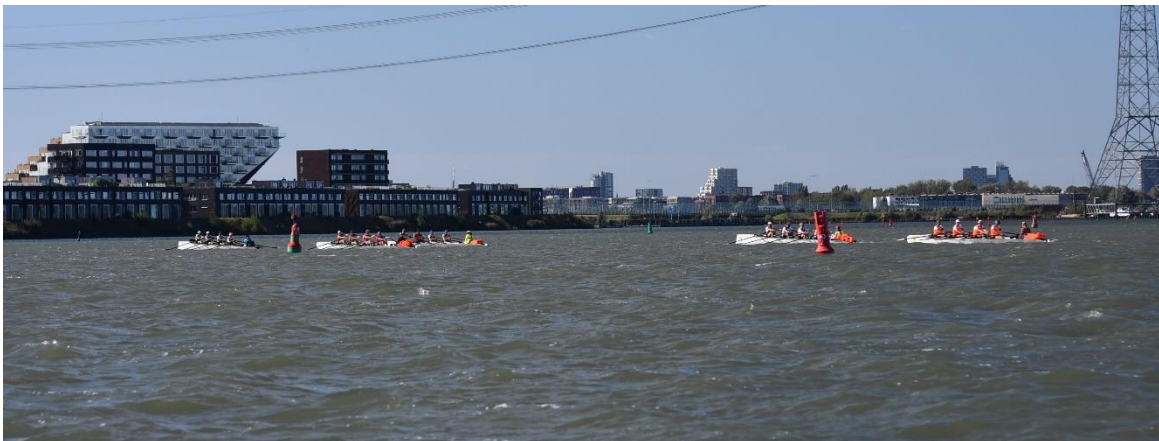
Roeien op het open water van het IJmeer

Met 38 deelnemende ploegen was dit de grootste coastal wedstrijd van het jaar in Nederland. Instappen vanaf het strand bij het Amsterdam Coastal Rowing Centre maakte het de organisatie veel eenvoudiger dan vanaf vlotten zoals in het verleden. Dit jaar deden er drie Amstelploegen mee, maar we verwachten volgend jaar als de wedstrijd op 29 september wordt verroeid en niet gelijktijdig is met de Amstelbeker wedstrijd nog meer Amstelploegen. Zeker nu coastal olympisch wordt in 2028. Op naar de volgende editie volgend jaar die ook in het teken zal staan van ons 150 jarig jubileum.