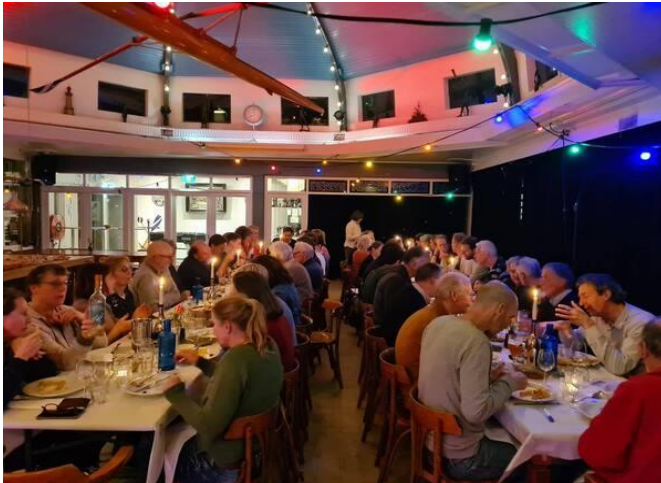
Impressie van de gezelligheid tijdens de jaarlijkse wedstrijddiners (H&H diner '23)

concurrentie werd uitvoering besproken, en er werden tips en adviezen gedeeld. Dit seizoen organiseer ik wederom een mooi Novembervierendiner, en kijk er nu al naar uit.