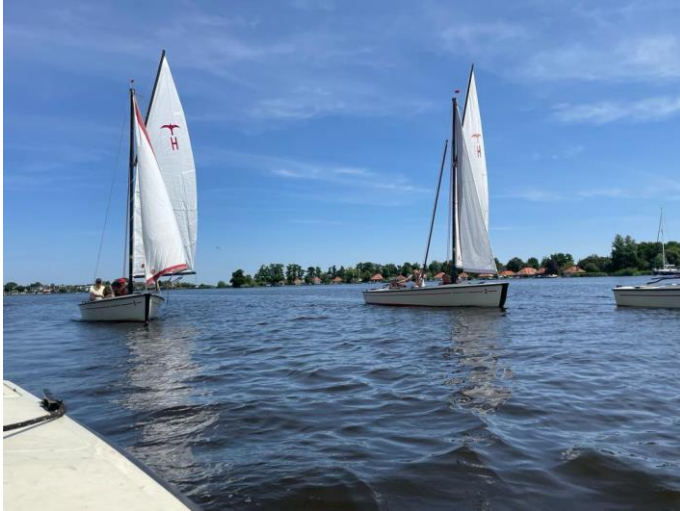
Zomerse omstandigheden tijdens het ZCA-uitje

Op zaterdag 17 juni 2023 vertrokken wij met 16 deelnemers vanaf onze roeivereniging naar Sloepverhuur, Zeilbootverhuur en Jachtwerf Hoogenboom Kaag op Kaageiland. Daar aangekomen, zeilden wij op vier polyvalken op De Kagerplassen.