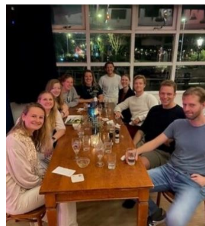
Jong Amstel op verschillende manieren in actie

Dit jaar hebben we verschillende activiteiten georganiseerd en zijn we gestart met een vaste trainingsavond op dinsdag waarbij we gezamenlijk op de ergometer stappen of het krachthonk in duiken. Deze avond vindt inmiddels gretig aftrek met elke week zo'n 10-20 deelnemers. En 1x in de maand gaan we daarna ook nog gezellig met elkaar eten!