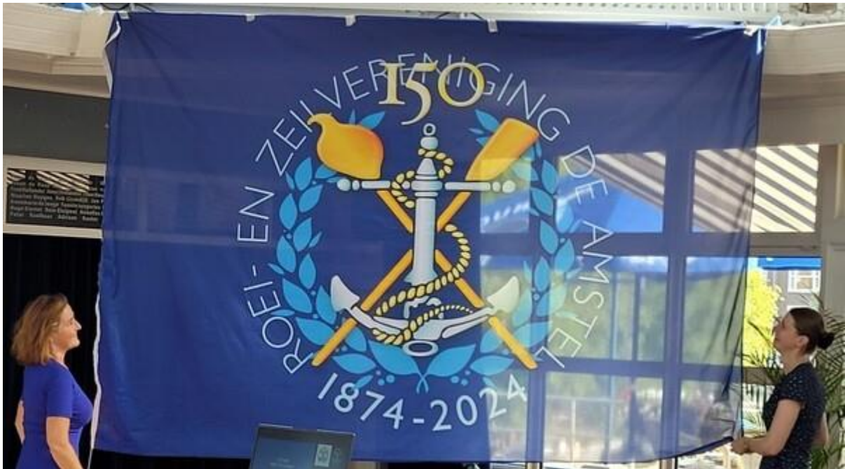
Vol trots onthult de commissie het jubileumlogo, ontworpen door Lex Warnies.

Om het jubileum extra glans te geven is er een jubileumlogo ontworpen door Lex Warnies. Het logo werd onthuld op de 149 e verjaardag van de vereniging en met applaus ontvangen.