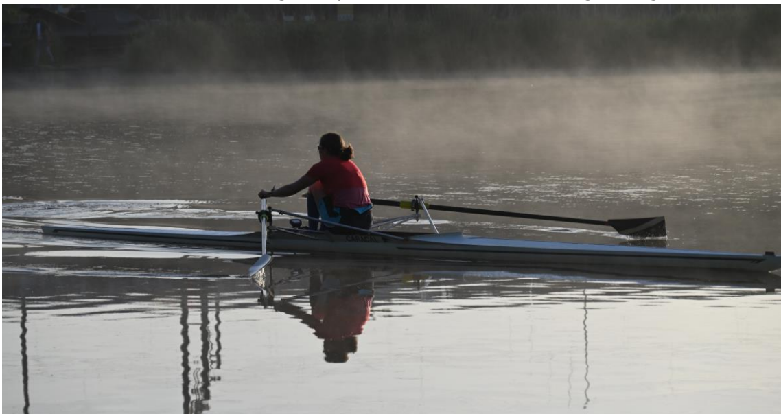
De magie van de vaardigheidsproef vastgelegd op een vroege zaterdagochtend

Gezien de lage belangstelling zijn we ons aan het oriënteren of een dergelijke proef nog wel gewenst is of dat we op een andere manier of op een ander moment de vaardigheidsproeven zullen afnemen. Of dat we op een andere manier moeten gaan communiceren over de vaardigheidsproef, zodat er meer belangstelling komt.