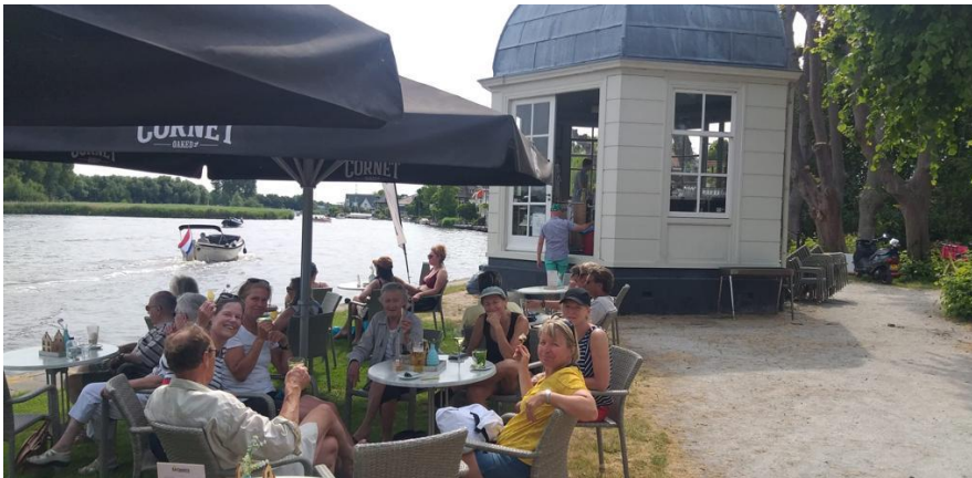
Lunchen in luxe aan de Kaag

Na afloop ging een ieder huiswaarts onder de veel gehoorde opmerking: "Wat was dit een fantastische dag!"