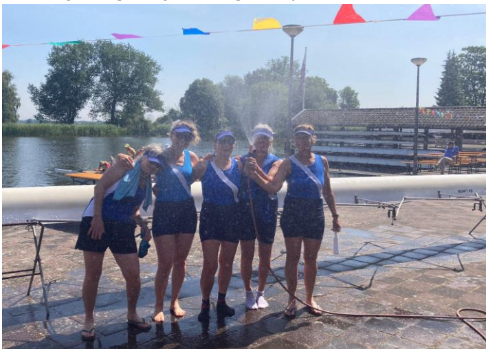
Wedstrijdmasters koelen af na zonovergoten wedstrijddag in Weesp

Naast de Novembervieren en de Voorjaarswedstrijden keken de ploegen ook verder dan Amsterdam. Met succes (blik!) op de Spaarne Lenterace in mei, een vrolijke maar fanatieke wedstrijd in Heemstede. Maar zo ook de Vechtrace in juni, een wedstrijd van 5 km over de bochtige Vecht, die minder bekend is bij de meeste roeiers, maar ook zeker de moeite waard is! Kijk voor komend seizoen eens naar de KNRB wedstrijdkalender. Daar zijn ongetwijfeld nog wat parels te ontdekken.