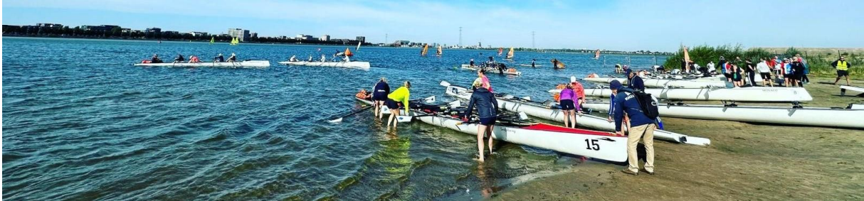
Beachstart op IJburg

24 september werd de 5e IJmeer Challenge verroeid. De Amstel organiseert deze wedstrijd samen met de Watersportvereniging IJburg. De IJmeer Challenge is de afsluitende wedstrijd van het KNRB Coastal Klassement.