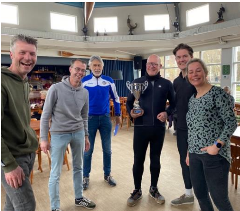
De winnaars van "De Kop" met de wisselbeker

Op 16 april 2023 vond de 18e editie van de Amstelmarathon plaats. De wedstrijd werd verroeid over alweer een nieuw parcours. Vanaf de start bij ons clubhuis volgden de roeiers de Amstel tot het keerpunt een stukje voorbij Vrouwenakker om vervolgens weer dezelfde weg terug te vatten naar de finish in de Kom. Er waren slechts 8 deelnemende Ploegen.