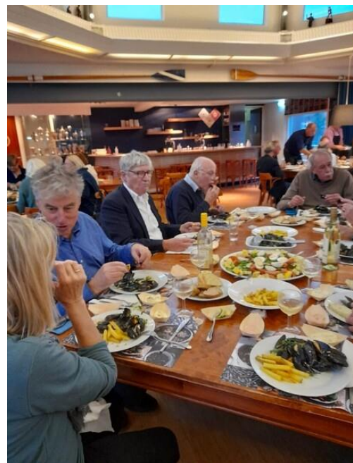
Traditionele mosselavond met de Scheeve