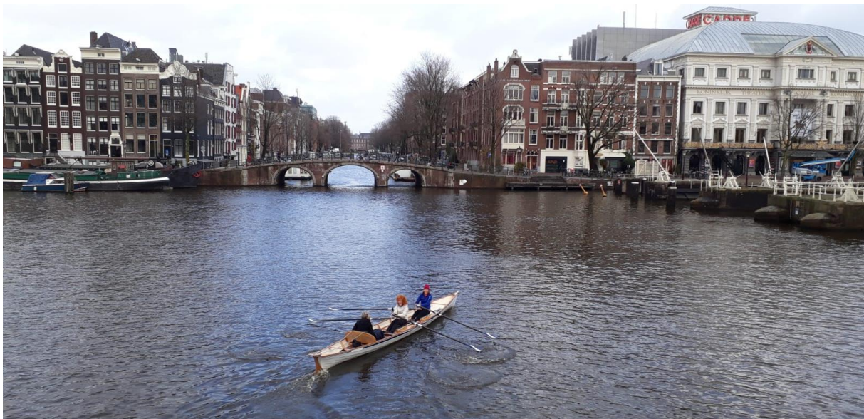
De Koning Wintertocht voert o.a. door de sluisen voor Carré

In december is het op weekenddagen veel rustiger op het water en zit de Toercommissie niet gespannen te wachten tot alle boten, deels geleend van andere lokale roeiverenigingen, weer binnen zijn. Over belangstelling hebben we als commissie die helaas uitgedund is tot twee leden niet te klagen. De KWT van '22 was voltekend en voor de komende tocht op 9 december hebben we enkele teams moeten teleurstellen. We komen gewoonlijk wel aan het benodigde materieel, maar de zitruimte in de sociëteit is beperkt om nog te zwijgen over de cateringfaciliteiten van onze pachter, met wie we inmiddels een uitstekende relatie hebben. Vorig jaar meenden we er goed aan te doen de traditionele erwtensoep een keer af te wisselen met een high tea, maar voor de roeiers met boten van andere clubs bleek dat ze zich bijna