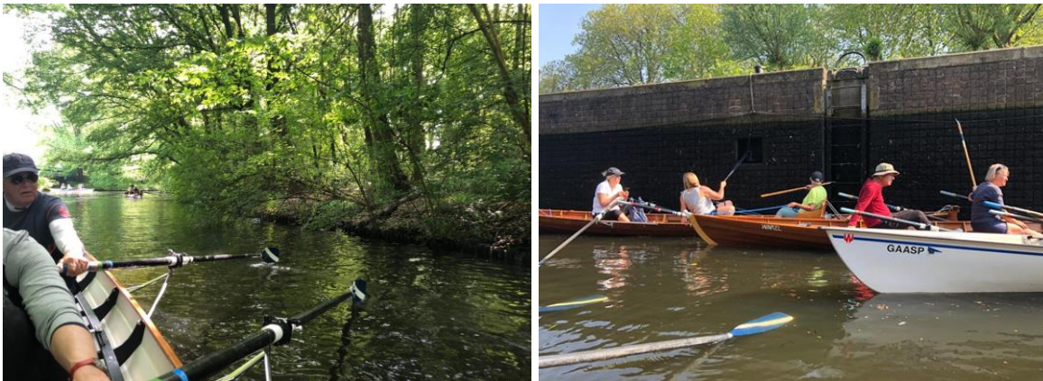
De Midweekers maken uitdagende en prachtige tochten door en rond Amsterdam

Deze keer was er één tocht op zondag (Driesluizen) voor roeiers die door de week aan het werk zijn. Er waren redelijk wat deelnemers.