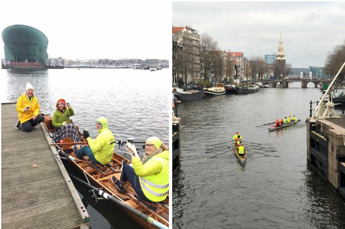
Een welkome warme chocolademelk halverwege de Koning Wintertocht

Heb je zin om 2 maal per jaar ( juni , december) mee te helpen bij het organiseren van een Amsterdamse roeitocht voor met name roeiverenigingen van buiten Amsterdam, laat het ons weten!