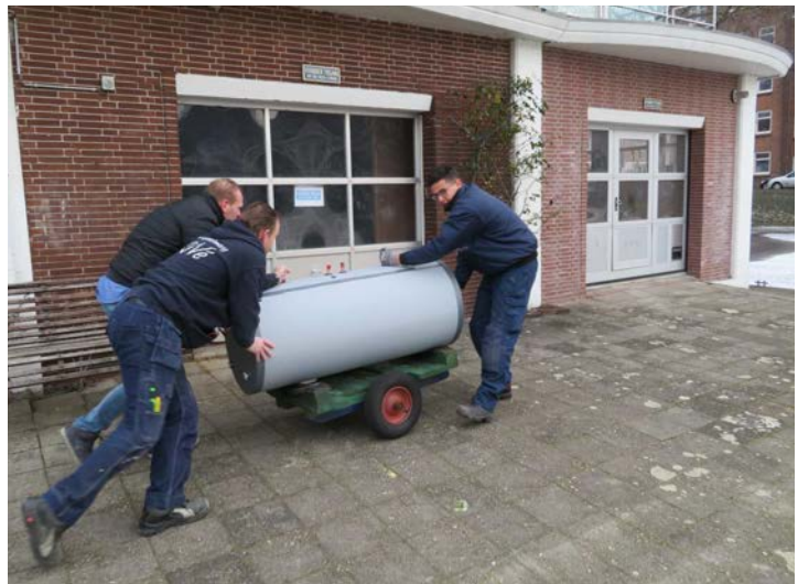
Een nieuwe ketel na een periode van koud douchen

Ook in het verenigingsjaar 2017– 2018 zijn er veel zaken uitgevoerd in en rond het gebouw. Het jaar begon wat het gebouw betreft slecht. De warmwatervoorziening voor de douches viel in december onverwachts uit. Ons toenmalige vaste installatiebedrijf kon het probleem niet oplossen. Dit kwam onder andere doordat we geen standaard huisinstallatie hebben. Onze installatie vereist een meer dan gemiddelde kennis en kunde om defecten te kunnen oplossen. Daar kwam bij dat het installatiebedrijf afspraken vaak niet nakwam. Het zoeken en vinden van een nieuw, kwalitatief goed installatiebedrijf moest zorgvuldig gebeuren. Door de hoogconjunctuur in de bouw en onze specifieke situatie bleek het lastig te zijn om een passend bedrijf voor onze vereniging te vinden. Het hele proces kostte daardoor meer tijd. Na een selectie hebben we uiteindelijk de firma Révé de opdracht verstrekt om de problemen te verhelpen. Er is een nieuwe 64 kW cv-ketel geïnstalleerd welke Vaillant tegen fabrieksprijs aan ons heeft geleverd. Tevens is er een nieuw groot boiler vat geïnstalleerd.