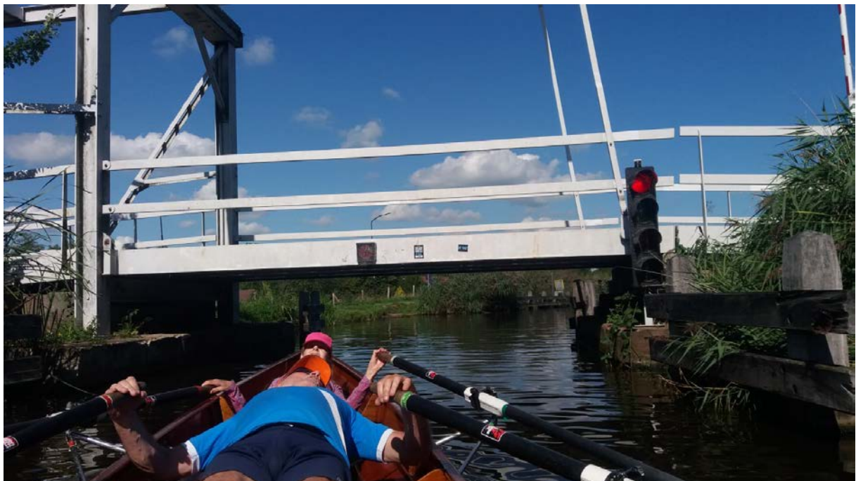
Bruggen vormen geen hindernis bij het midweekroeien