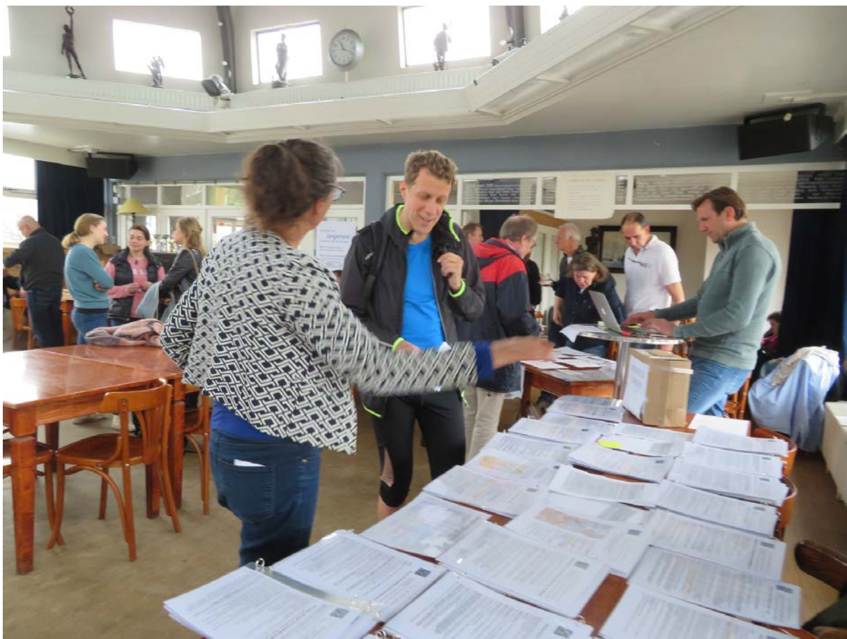
Tijdens de voorjaarsmarkt was er veel interesse voor het midweekroeien

Afgelopen jaar is er voor het eerst een Voorjaarsweekend gehouden met op de zaterdag een Informatiemarkt en op zondag de Amstelmarathon. De leden moesten nog even wennen, want vooral in de ochtend werden de kraampjes van o.a. de Amstelmarathon, het Midweekroeien, het Infoteam en de Zeilcommissie goed bezocht. De Scheeve Pomerans en de Ergoheadcommissie maakten de ochtend extra levendig door demonstraties en wedstrijdjjes te organiseren. Uit de enquête die naderhand aan de 'standhouders' is gestuurd bleek voldoende verbetering voor de informatiemarkt te halen, maar allen waren het er over eens dat in het nieuwe jaar weer een markt georganiseerd mag worden.