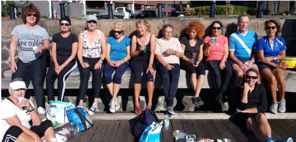
Even uitrusten in het zonnetje