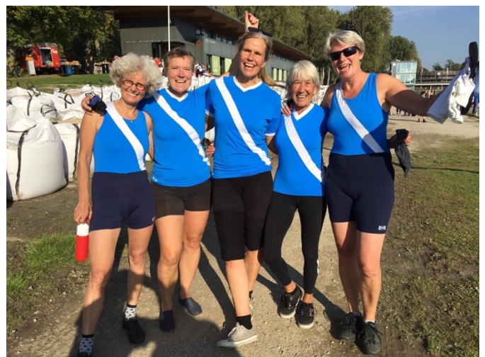
De winnende Amsteldames!

Ook dit jaar hebben de vijf burgerroeiverenigingen van Amsterdam en Ouderkerk weer regiowedstrijden georganiseerd. Vooral het dames C4 veld was goed gevuld met op de laatste wedstrijd op de Bosbaan negen ploegen. Het weer zat mee en alle wedstrijden waren zonovergoten. Met een flinke portie enthousiasme en flinke taarten voor de winnaars werden alle vijf wedstrijden een groot succes. Van De Amstel deden de laatste paar wedstrijden drie ploegen mee, twee damesploegen en een zeer internationale herenploeg (vier nationaliteiten), waarvan enkele leden nog maar een paar maanden roeiden. En ze wonnen! De damesploeg 'Go with the Flo' won in de C4 categorie de overall prijs voor de hele reeks wedstrijden met een bloedspannende laatste wedstrijd op de Bosbaan. Voor beginnende of al ervaren roeiers, die nog geen echte wedstrijden hebben gedaan, is dit een uitstekende manier om wat wedstrijdervaring op te doen. We zetten deze activiteit de komende jaren voort.