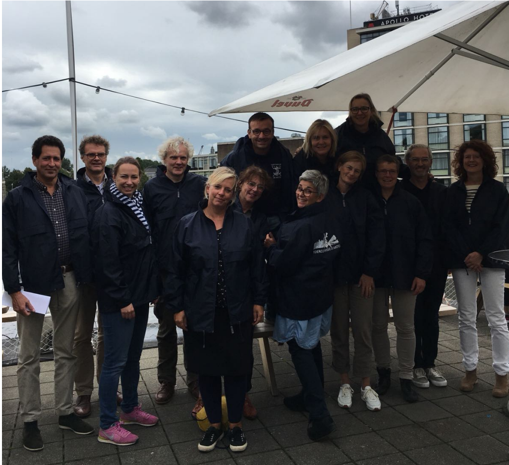
Het team vrijwilligers van de Nationale Avondtocht

ontploften! Na kort overleg besloot de toercommissie dat het onverantwoord was om de gasten zondag naar Amsterdam te laten komen. Binnen een halfuur werden alle deelnemers per app en email geïnformeerd over het besluit om de toer af te blazen, hetgeen veel waardering en opluchting oogstte bij de deelnemers.