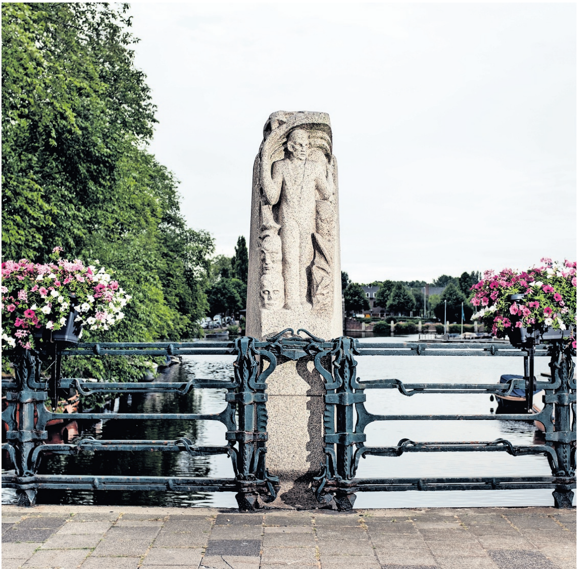
→ Een van de beelden op Boerenweteringbrug in de Van Hilligaertstraat.